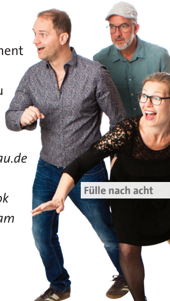
Fülle nach acht