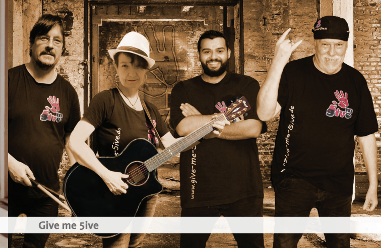
Give me 5ive