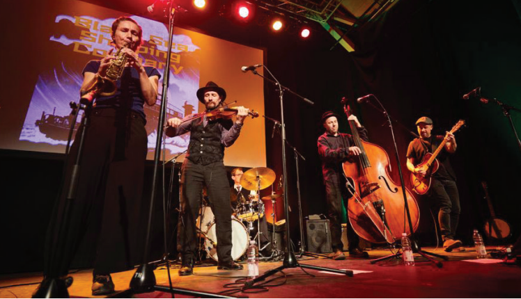
Black Sea Shipping Company