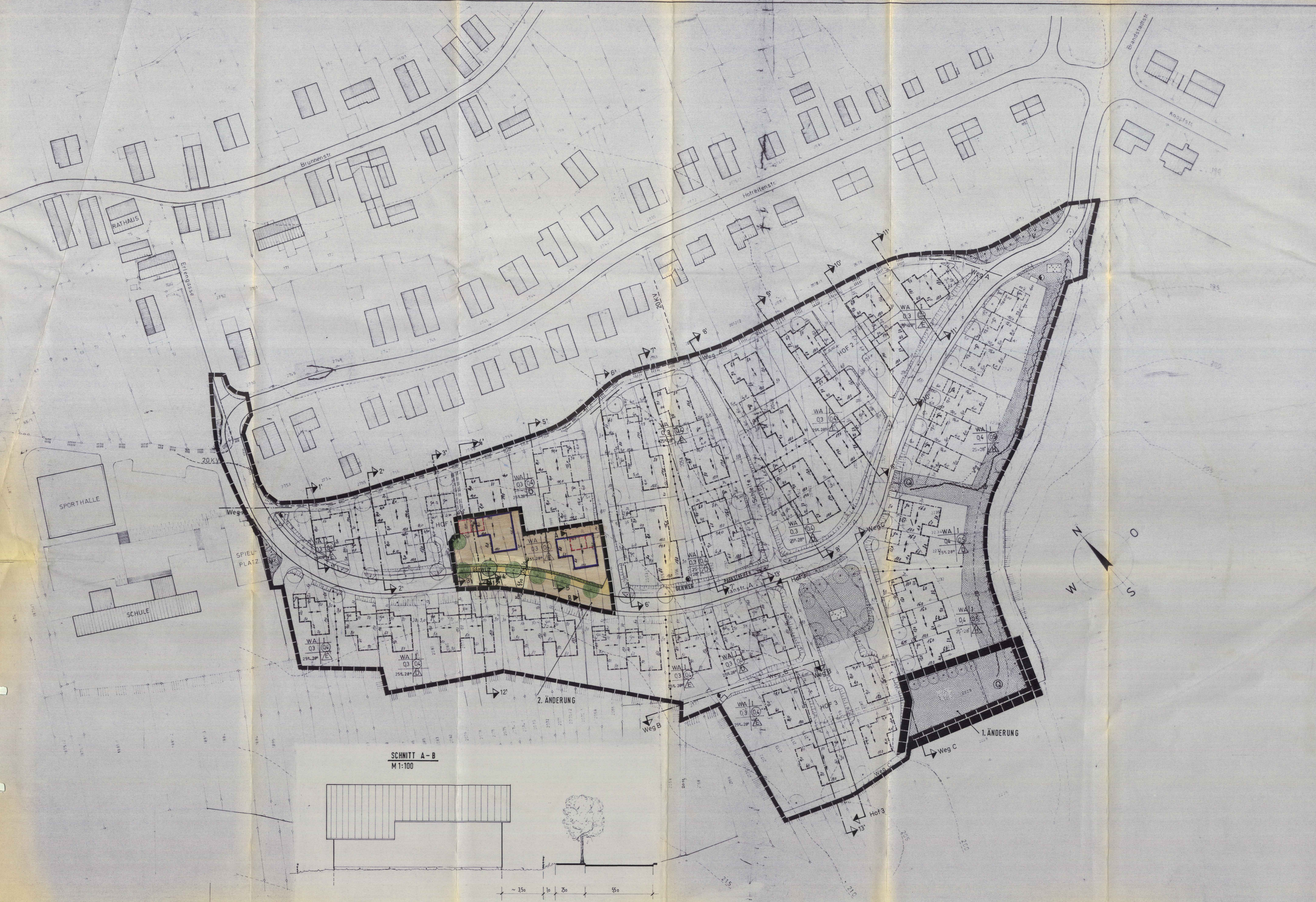
SCHNITT A-B M 1:100